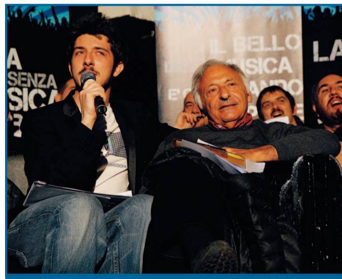
Ruffini e Mogol durante la finale dello scorso anno