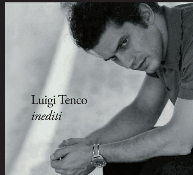
Luigi Tenco inediti